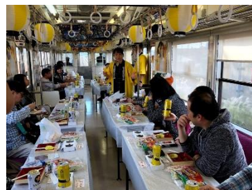
-昨年のビール列車の様子- 「ビールのおいしい飲み方講座」