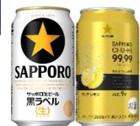
「サッポロ生ビール黒ラベル」と 「サッポロチューハイ 99.99」

当日は八千代台駅を出発し、3500形の臨時列車で東成田駅へ向かいます。車内では「サッポロ生ビール黒ラベル」と「サッポロチューハイ 99.99」を1本ずつご提供、前日も好評をいただいたサッポロビール社員による「ビールのおいしい飲み方講座」も開催。サッポロビール試供品のお土産も付いています。