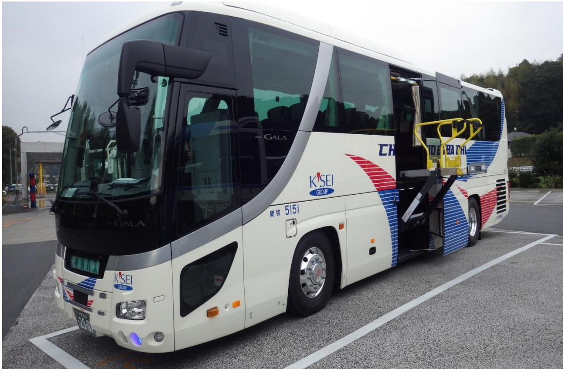
リフト付き観光バスの外観

お客さまに安心・快適にご利用いただけるバスを目指して リフト付き観光バスを導入しました！