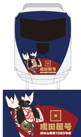
『成田屋号』ヘッドマーク(イメージ)