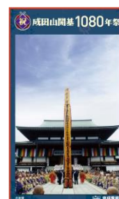
ラッピング画像(一例)